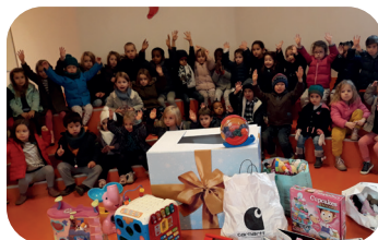
Laisse parler ton cœur - édition 2018