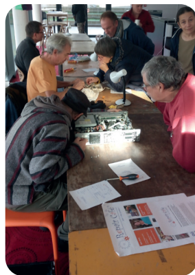
Repair Café - SERD 2018