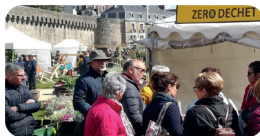
Vannes côté jardin - édition 2019