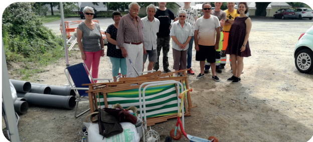
Collecte du réemploi à Saint-Gildas de Rhuy