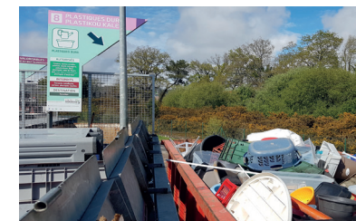
Benne plastiques durs - déchèterie de Tohannic.