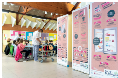
Le restaurant scolaire d'Arradon fait partie des 4 cantines accompagnées par l'agglomération.