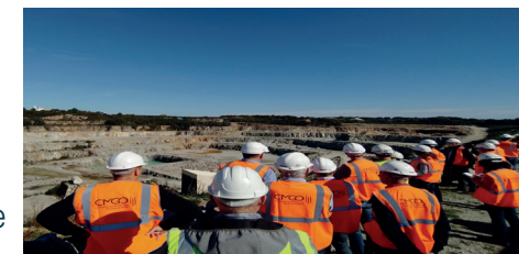
Visite de CMGO à Grand-Champ.