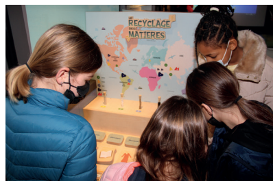
Le bus environnement propose une nouvelle exposition sensibilisant aux enjeux environnementaux.