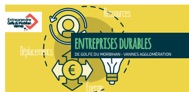
L'agglomération propose une offre de services économie circulaire aux entreprises du territoire.