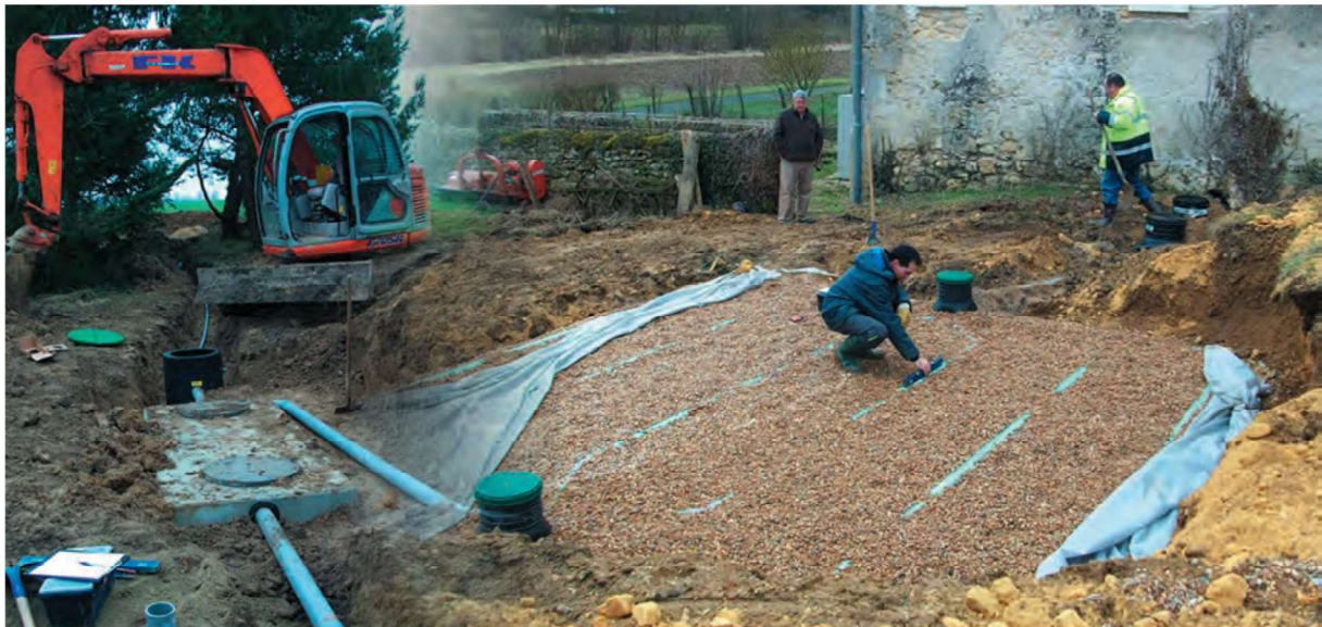
Fosse toutes eaux et filtre à sable