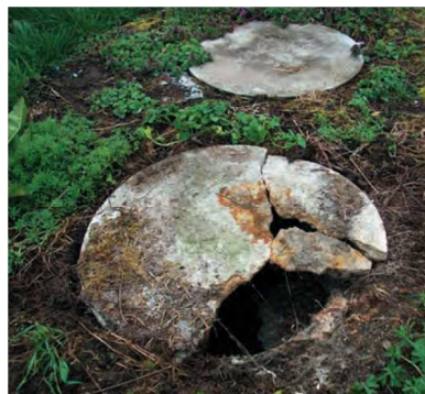
Couvercle de fosse toutes eaux corrodé