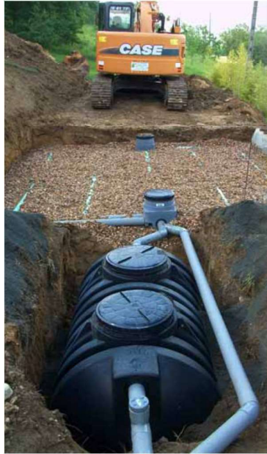
Photo : Fosse toutes eaux et filtre à sable

Le nombre d'installations domestiques et assimilées, contrôlées ou non encore contrôlées, situées sur le territoire du SPANC (indicateur DC. 306) au 31/12/2022 est de 12 368 (12 313 en au 31/12/2021).