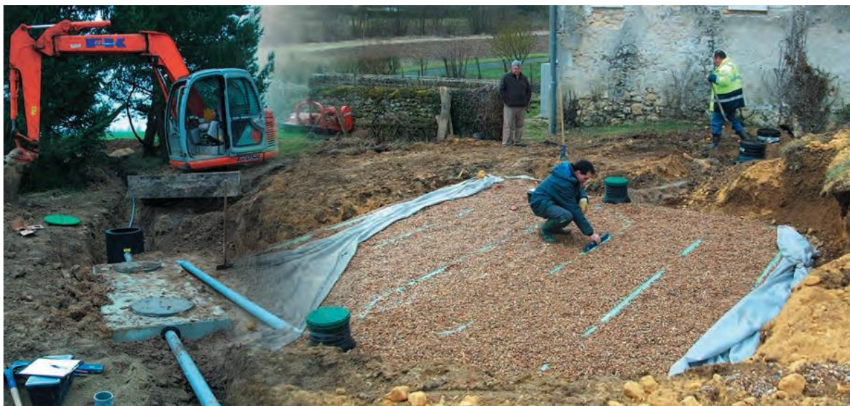
Fosse toutes eaux et filtre à sable

La diminution du nombre de contrôles de fonctionnement réalisés en 2023 par rapport à 2022 s'explique par une diminution du nombre d'agents du SPANC au début de l'année 2023.