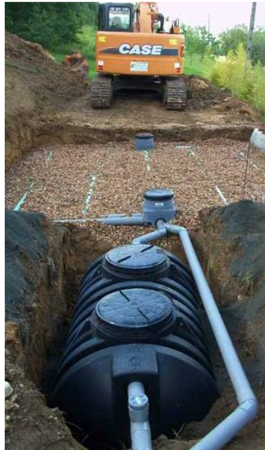
Photo : Fosse toutes eaux et filtre à sable

Le nombre d'installations domestiques et assimilées, contrôlées ou non encore contrôlées, situées sur le territoire du SPANC (indicateur DC. 306) au 31/12/2023 est de 12 113 (12 368 en au 31/12/2022). Cette diminution s'explique par la fin de l'exercice de la compétence sur les communes de Lauzach, Berric et La Vraie-Croix.