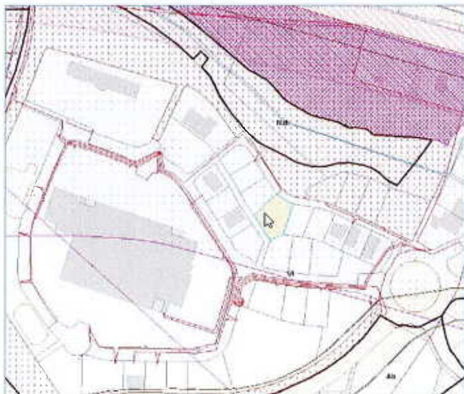
Plan des servitudes et des réseaux

Cette parcelle est desservie par tous les réseaux